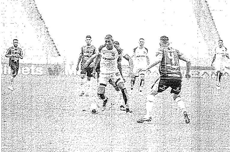
No momento, o Alvinegro de Porangabussu vem tendo que enfrentar um calendário apertado em razão da pandemia de covid-19

Em meio a maratona de jogos entre diversas competições, o Alvinegro de Porangabussu tenta se manter focado para a partida decisiva de hoje à noite (20) contra o Bolívar, na Arena Castelão, pela quinta rodada da fase de grupos da Copa Sul-Americana. O Vozão, que atualmente tem seis pontos em seu grupo, tendo a possibilidade alta de classificação para a fase eliminatória, vem buscando manter um equilíbrio entre os diversos campeonatos a disputar. Promovendo um rodízio e poupando jogadores importantes em algumas partidas.